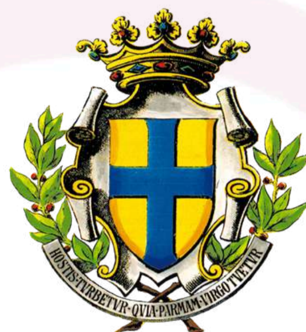
COMUNE DI PARMA