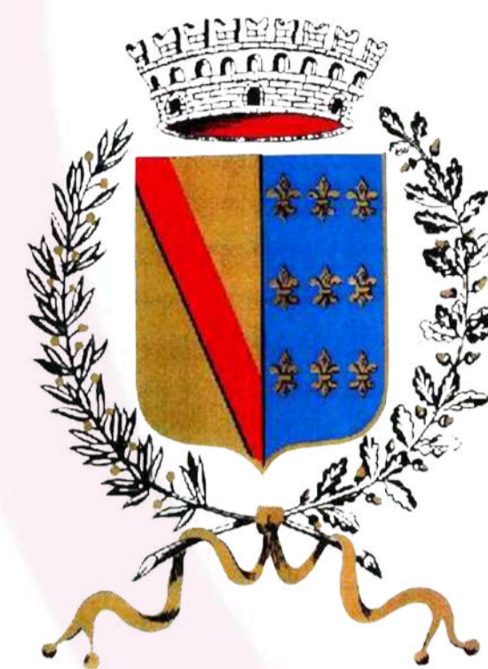
Comune di Sala Baganza