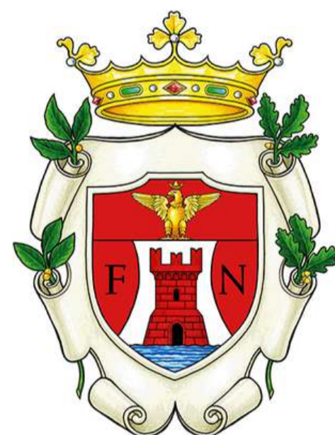
Comune di Fornovo di Taro