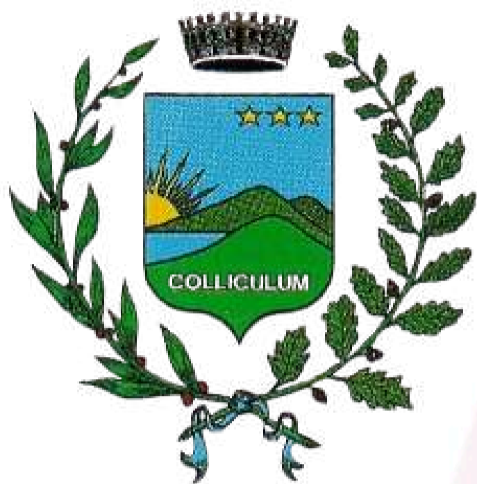
Comune di Collecchio